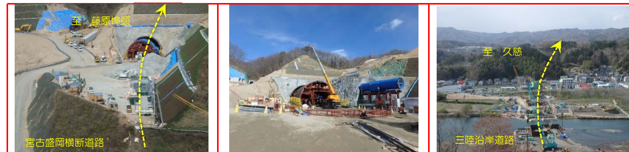
②施工：前田建設工業

トンネル工事は、5月1日時点で全長1071mのうち320mまで進んでいます。 トンネルの入口で、コンクリート打込用の型枠台車（セントルと呼びます）を組立てました。 閉伊川では、橋脚9基、橋台2基の構築工事も進めています。