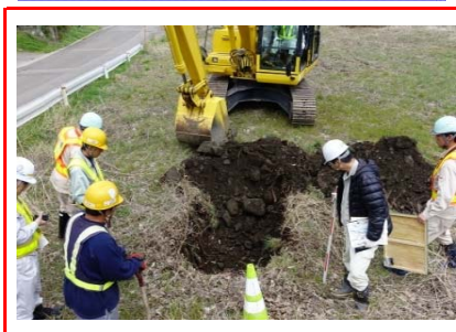
⑨施工：戸田・岩田地崎JV

仮栈橋を設置するための河床進入路を作っています。 工事用進入路への右折レーン設置のため、車線規制を行い国道を切回す工事を行っています。